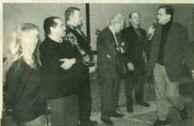
Nieuw bestuur van de BOZ wordt voorgesteld

Om de nieuwe bestuursleden van de bewonersorganisatie Zevenkamp voor te stellen, moest de presentator ze eerst uit de zaal plukken. Om te benadrukken dat ze niet uit de hoogte op de bewoners neerkijken, zaten ze niet zoals te doen gebruikelijk op een verhoging achter een lange tafel, maar gewoon verspreid in de zaal tussen de andere mensen.