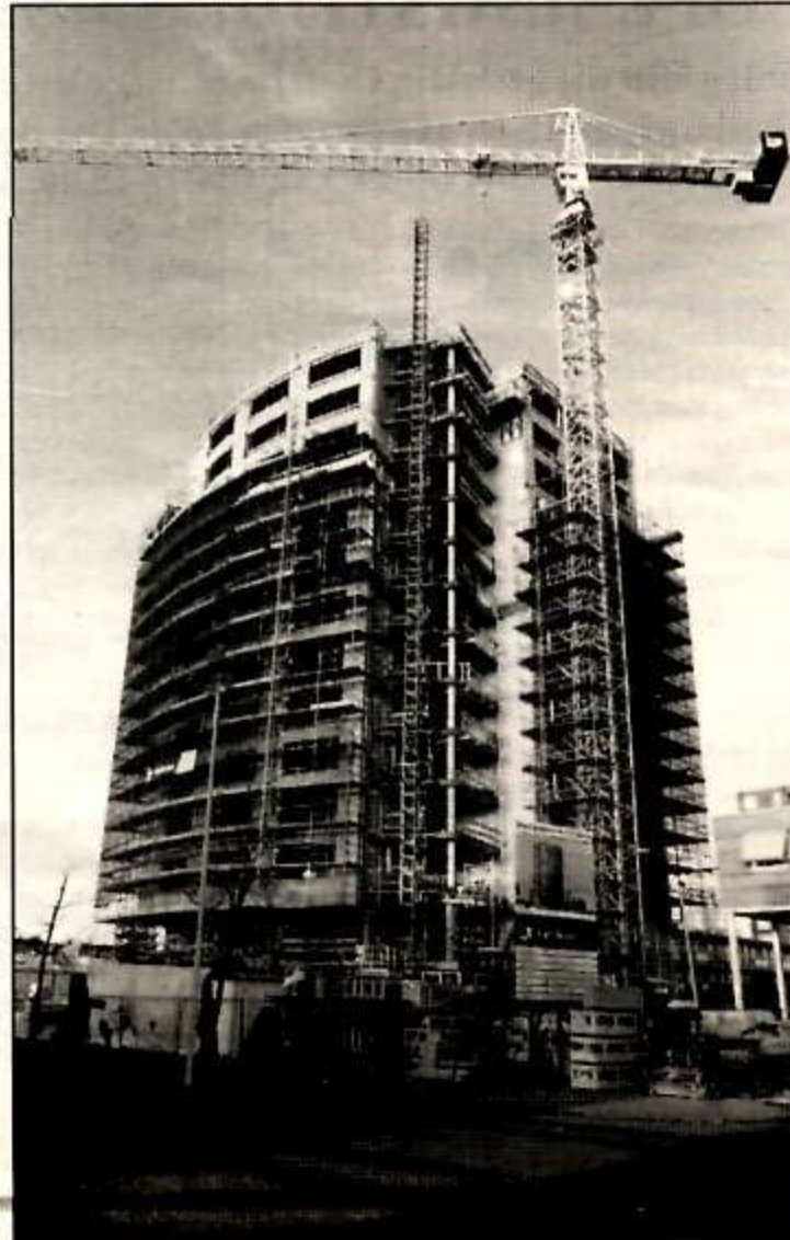
Op 19 November 1998 werd de vlag gehesen en het feit gevierd, dat de toren van het hoogste dak was voorzien.