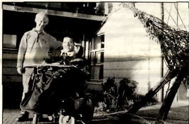
Twee medewerkers voor "De Griffioen"

Op 5 november j.l. werd de 'Griffioen', één van de gebouwen van 'Orion' voor mensen met een verstandelijke handicap, officieel geopend.