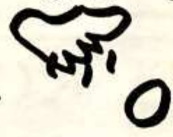
dit is de kip getekend door Jeffrey