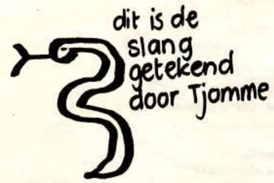
dit is de slang getekend door Tjomme