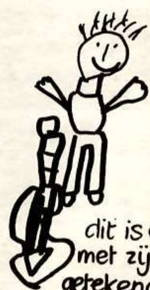
dit is Orlando met zijn viool getekend door Hava.