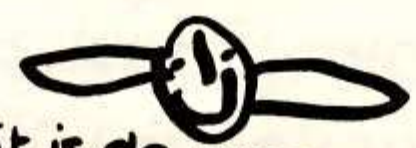
dit is de meeuw getekend door Soviëne

de kinderen uit groep 1-2. o.bs. De Waterlelie