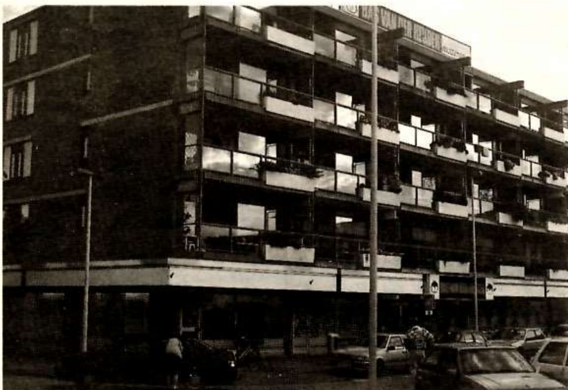
Wooncomplex "De Ring"

De acties van de woningen boven bas v.d. heijden aan de zevenkampsering tegen het slechte onderhoud hebben na anderhalf jaar geleid tot een succes.