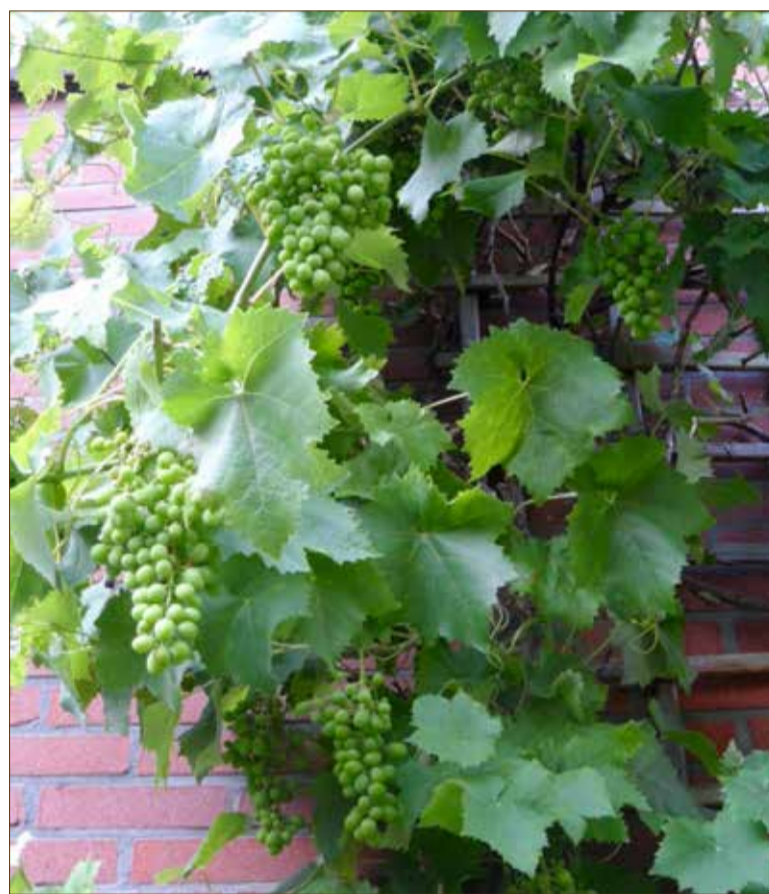
Druiven groeien ook zeer goed in Zevenkamp.

Uw oplossing vóór 1 september 2018 inleveren bij de BOZ/WIP, Ambachtsplein 141 - Rotterdam of stichtingboz@outlook.com