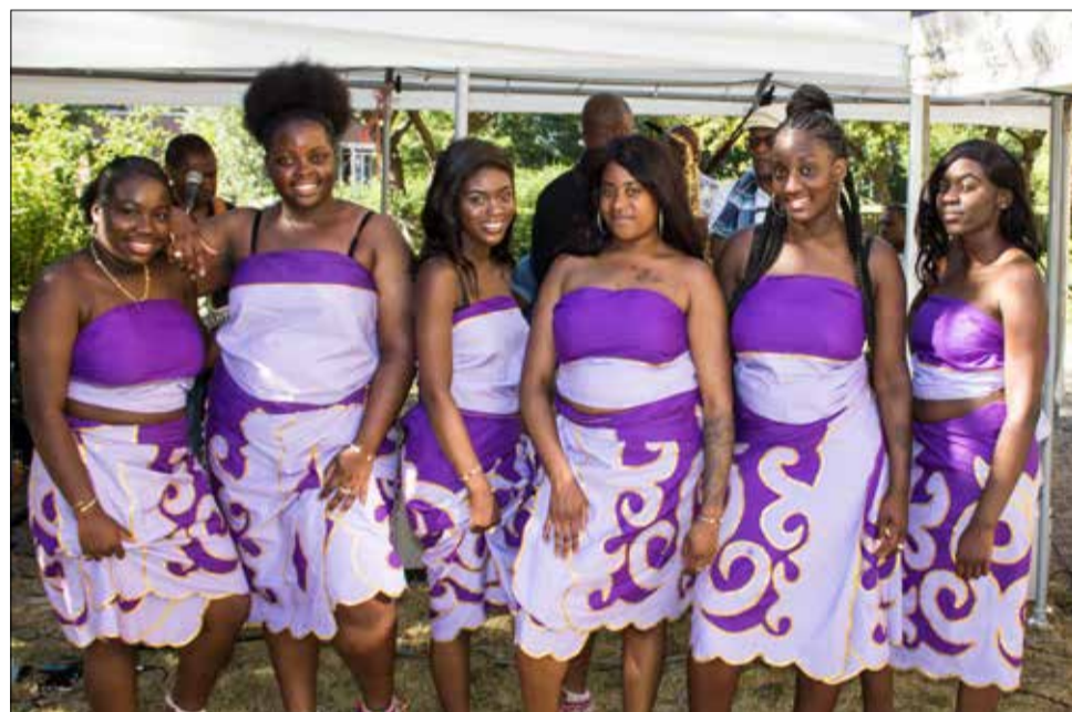
De foto van de week in de Havenloods was deze keer van onze eigen fotograaf: Kees Bosman!!