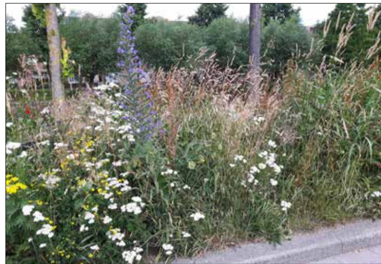
Welkomstkleurenpracht langs fietspad Zevenkampse Weg geeft vrolijkheid.

N N I L L A T T E L L A V E I K E J P O K S U I N I V A D U Z E H E L S I N K I V A J K Y E R S E A H F L J U B L J A N A R I T G L U A E N I S I H C Y Q N N O R I O N A C I R O G D O P E N K U S H D H T K M I N S K P I E H B S D O A O U O K S O M R N D O M A D R E T S M A P E A I T N L E B B R M S S L E T M C S J O M X O E A G E S N O N O E T G L A U N R L Z P H J A S R W I B G D L I L A A A U S I A A I N E A R A L I V G D N A K R C G A L A I I B J E R E O E S A A I I G R D F U N L E O O C N J W P T R P B O D R L B B H E N E H T A A F H S C E A R A K N A V W N W D V H R Y B R U S S E L O C A N O M X