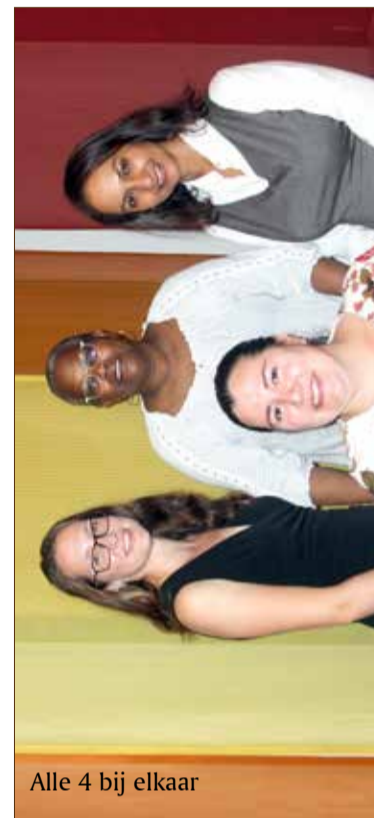
Alle 4 bij elkaar

Waarom ja tegen deze functie? Ik heb Ja gezegd tegen deze functie omdat dit een hele mooie kans is om te leren wat er in de wijk speelt. Ik wil graag weten wat de bewoners willen, zodat we de wijk nog beter kunnen maken.