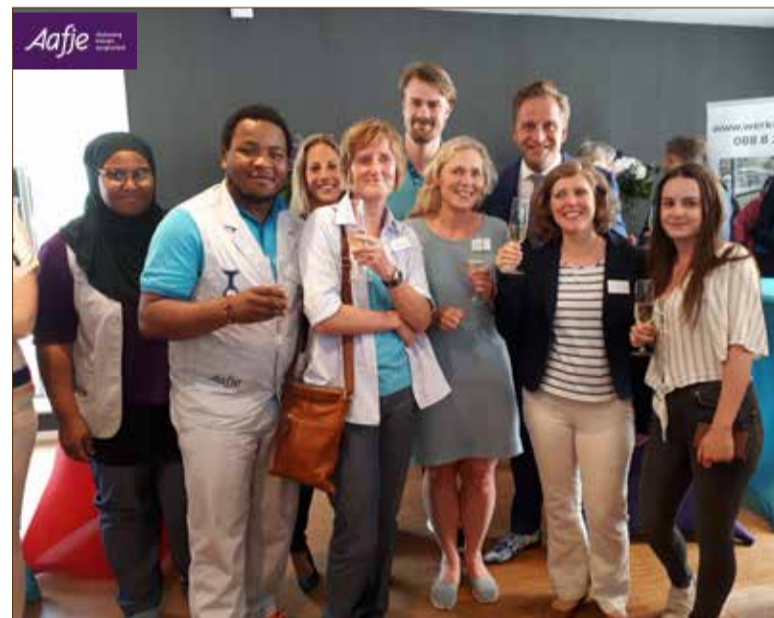
Aafje wijkverpleegkundigen met ketenpartners en minister De Jonge.

Tijdens de feestelijk bijeenkomst ging de minister in gesprek met wijkverpleegkundigen van Aafje aan de hand van door hen ingebrachte cases. Hierbij bleek dat goede samenwerking met ketenpartners, die ook aanwezig waren, om passende zorg op het juiste moment op de juiste plaats te krijgen ontzettend belangrijk is. Minister de Jonge was zeer geïnteresseerd en onder de indruk van de professionele en deskundige aanpak van alle betrokkenen. Hij benadrukte dat dergelijke samenwerking in de toekomst alleen maar zal toenemen en dat dit een goede ontwikkeling is. Na het ondertekenen van het akkoord nam de minister nog ruim de tijd om met de Aafje medewerkers en ketenpartners na te praten over hun boeiende vak.