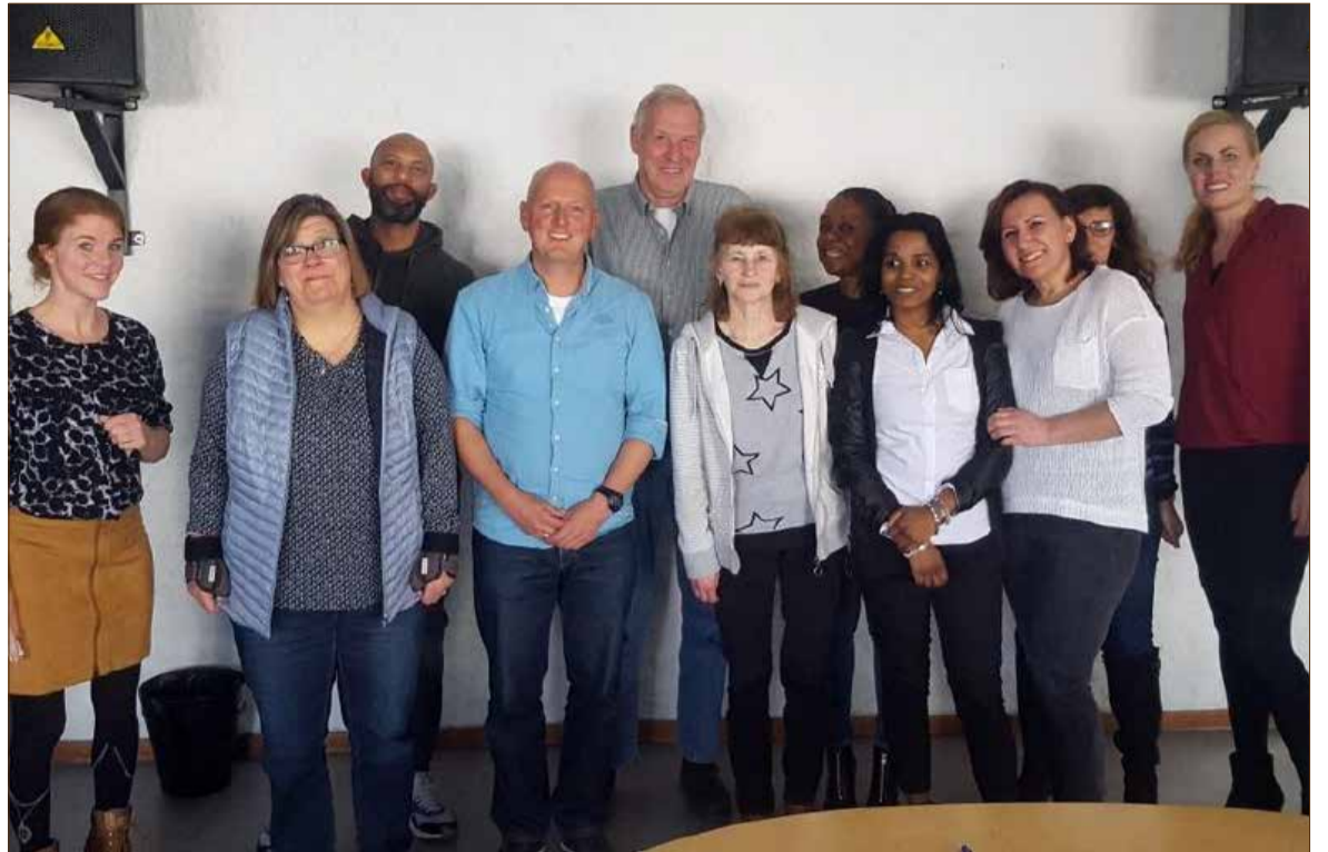
De trainingsruimte in het buurthuis.