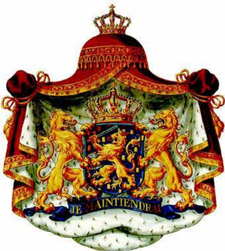
Boven: tekst op het Koningswapen: 'Je maintiendrai la vertu et noblesse.' Rechts: De Gouden Koets