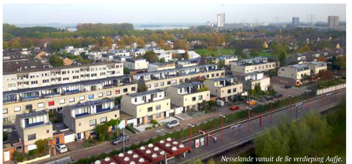
Nesselande vanuit de 8e verdieping Aafje.