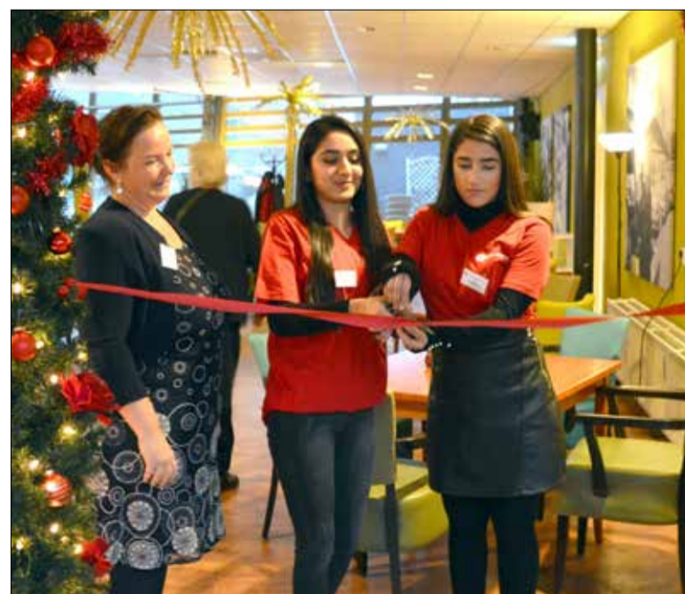
Studenten open het Wijkleerbedrijf met het doorknippen van een lint.

Wilt u meer informatie over het Wijkleerbedrijf? Neemt u dan contact op met één van de coördinatoren van het Wijkleerbedrijf. Dit kan telefonisch via ☎ 06 - 41172473 of via een email aan alexander-ommoord@wijkleerbedrijf.nl.