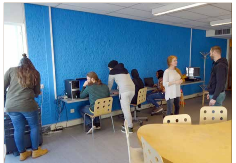
De trainingsruimte in het buurthuis.