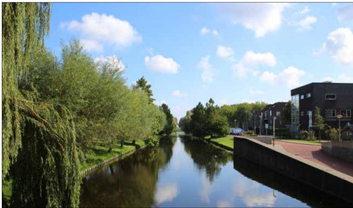
Zicht op de Zevenkampse Ring van Kees Bosman