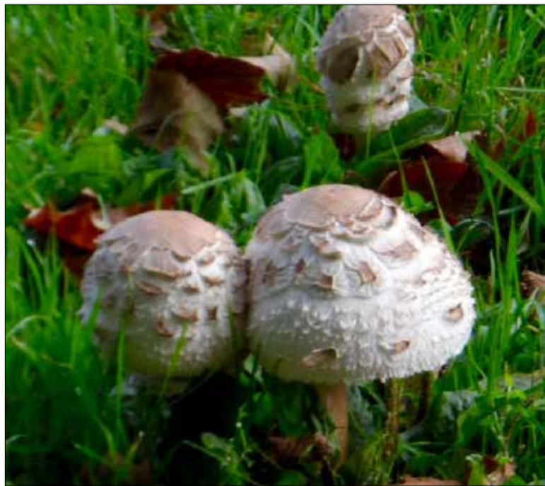
Vroege herfstpaddenstoelen van Elly Brevoort