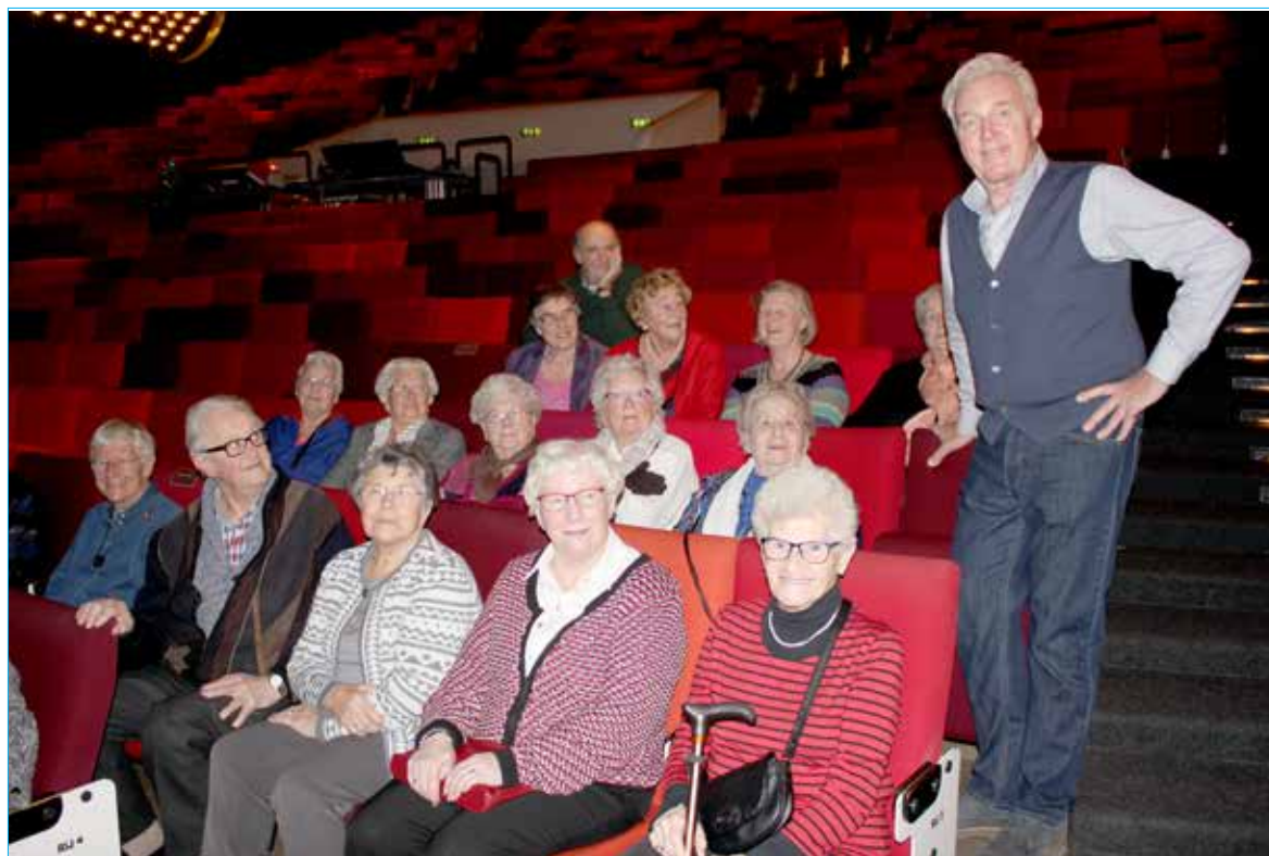
Met André van Duin in Luxor