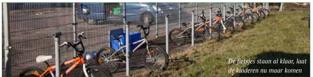
De fietsjes staan al klaar, laat de kinderen nu maar komen