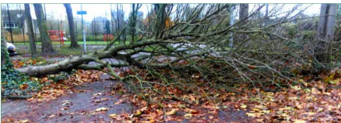
Een van onze trouwe lezers en rasechte Zevenkamper Frans Bracht maakte deze foto.