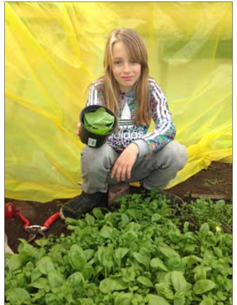
Wollefoppengroen in het groen