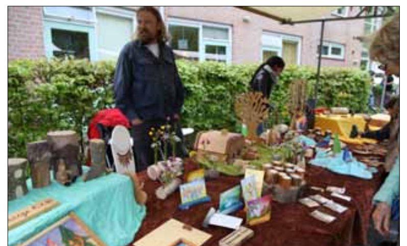
Hemelvaartsmarkt in Orion