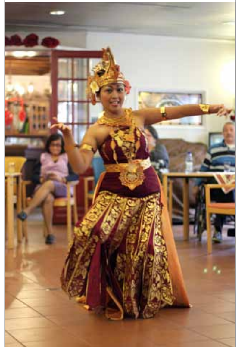
Dansen in de Vijf Havens