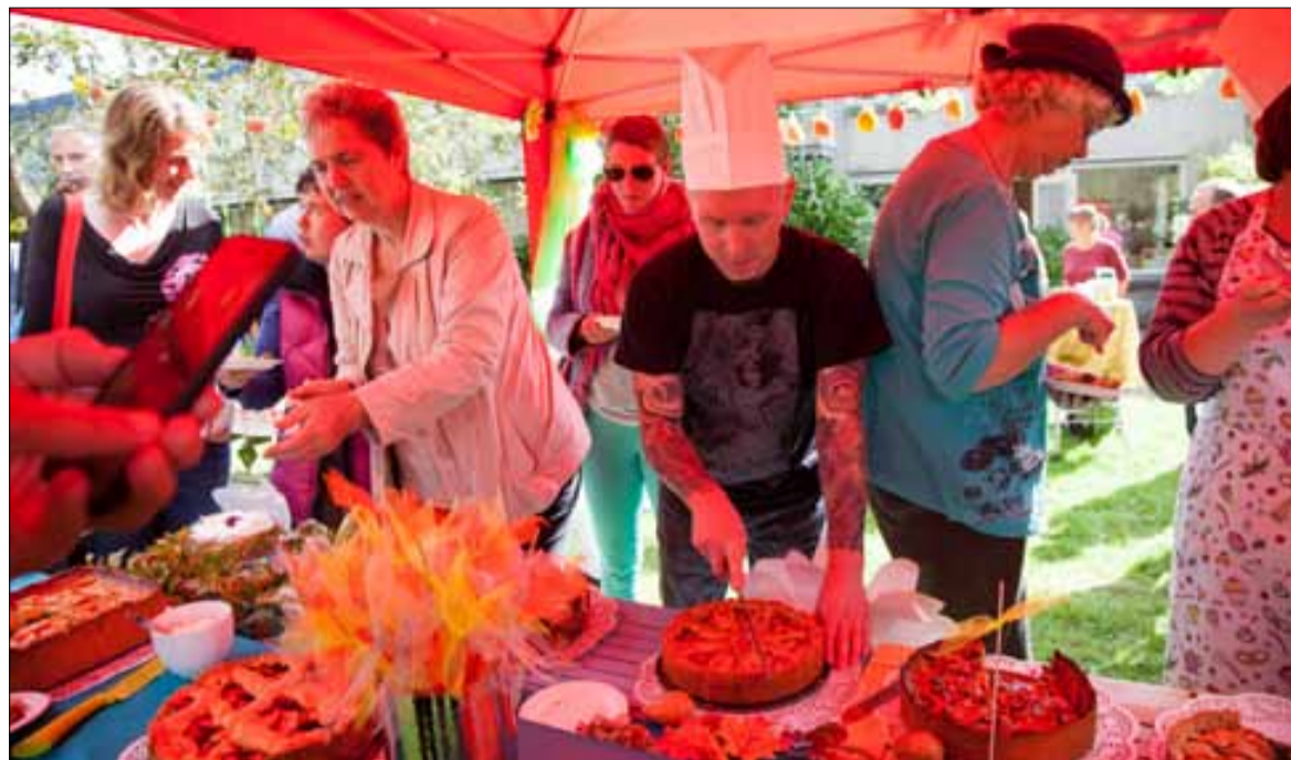
'Centraal Wonen 7kamp vierde Burendag wederom met het zeer geslaagde Appelfestival' "Onder het motto 'Heel CeeWee Bakt', was er een appeltaartbak-wedstrijd, waar de koks en de vele proevers zeer van genoten hebben! Volgend jaar weer!"