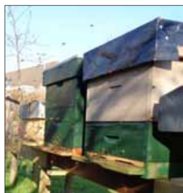
voorjaar en winter.