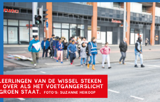
DE LEERLINGEN VAN DE WISSEL STEKEN PAS OVER ALS HET VOETGANGERSLICHT OP GROEN STAAT.

FEIJENOORD – Bij een ongeluk op de Laan op Zuid is op 22 september een jongen van 7 jaar omgekomen. De stoplichten op de plaats waar hij samen met zijn zusje en moeder overstak, werkten niet. Op het moment dat zij met hun fiets overstaken, begonnen ook de auto's weer te rijden. De jongen kwam onder een vrachtwagen terecht. TEKST: SHARON VAN OOST