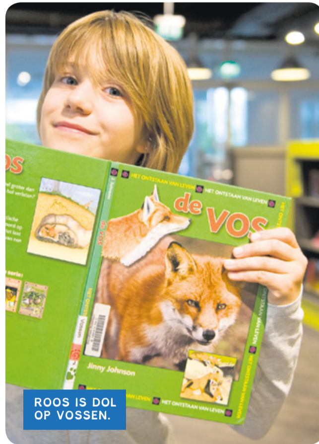
ROOS IS DOL OP VOSSEN.