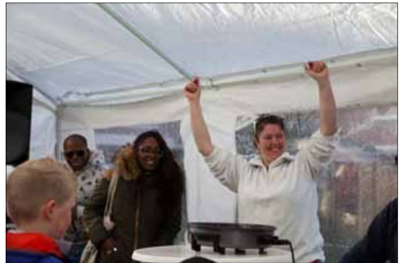
De hele speelplek bij Spinet-Blokfluit schoonmaken, de voortuintjes opknappen en dan lekker smullen. Enthousiaste vrijwilligers en kids kregen het weer voor elkaar. Hoogtepunt werd het muzikale swingen en de Karaoke. Ze hebben het bijzonder naar hun zin. NLdoet verbindt.