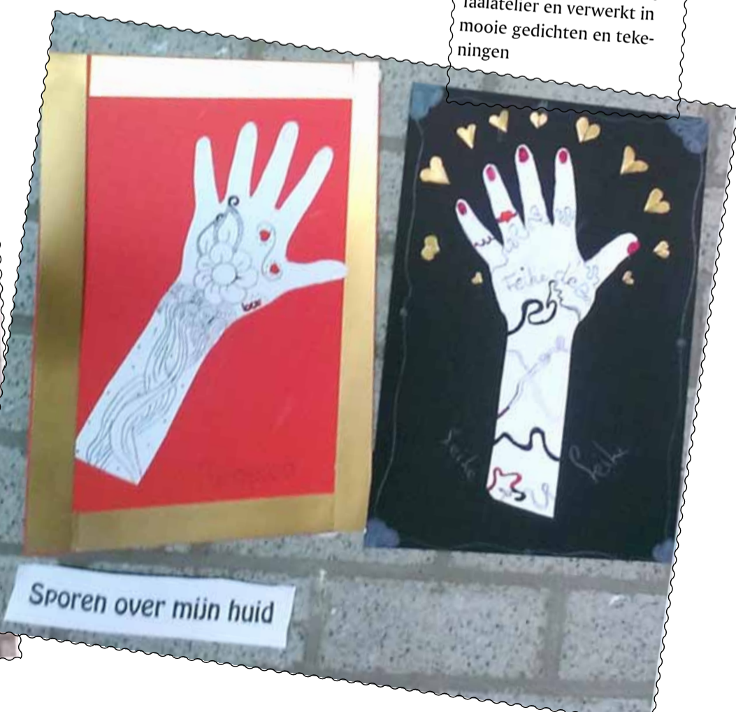
Sporen over mijn huid