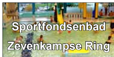
Sportfondsenbad Zevenkampse Ring