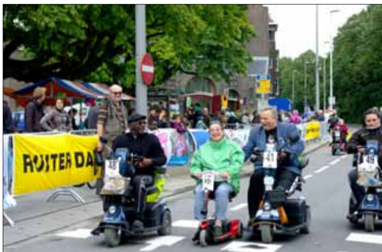
De scootmobiel is een heuse vereniging geworden. Succes!