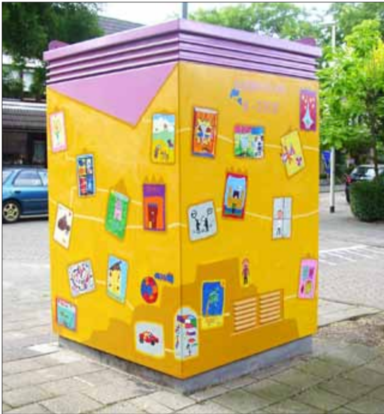
Formaat: 1m50 x 1m55 x 2m30, Opdrachtgever: Deelgemeente Prins Alexander, Locatie: Jan Jacob Slauerhofstraat / Herman Teirlinckstraat, Jaartal: 2010. Het trafohuisje heeft 45 raampjes van bewoners.

baby (waarvan de ouders hielpen) tot opa (die zijn kleinkind hielp). Ook wat stoere 'rappertjes' lieten zich niet onbetuigd en hun leefwereld kwam erbij. Ontdek jouw venster 'Hundertglasser'. Wie wil er nog rechte lijnen trekken? Raak van Friedensriech Hundertwasser, geboren als Friedrich Stowasser: „die gerade Linie ist gottlos“ uit zijn Verschimmelungsmanifest gegen den Rationalismus in der Architektur (1958). „Ik vind rechte lijnen in gebouwen saai“.