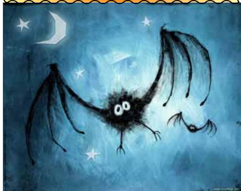
Aangeboden door winkeliersvereniging Zevenkamp & Bewonersorganisatie BOZ (SOMOR) & LCC Zevenkamp