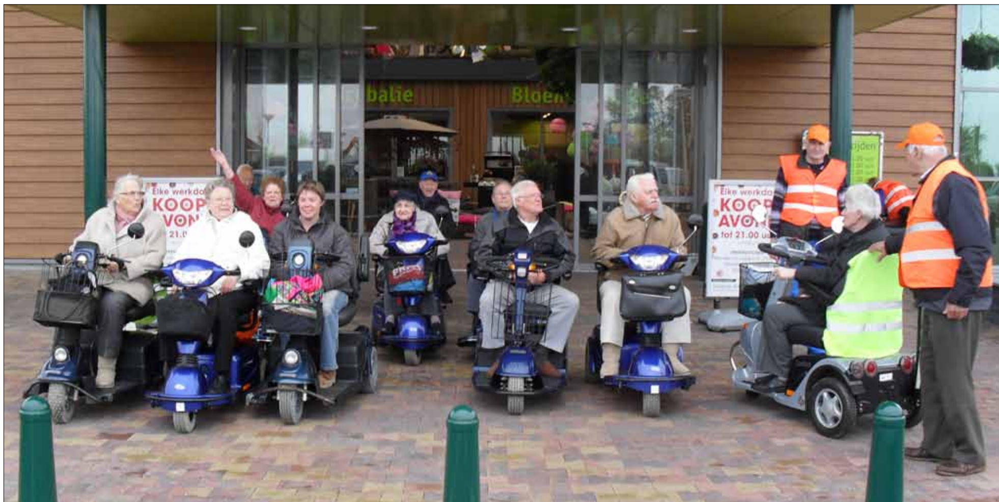
De Scootmobielclub Zevenkamp is weer op pad geweest. Zij bezochten een tuincentrum en daar dronken ze, voordat zij weer op huis aan gingen, een kop koffie.