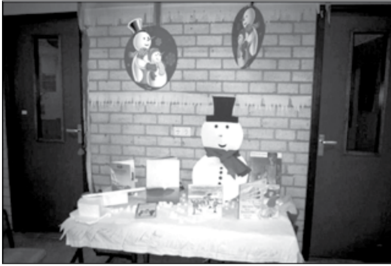
Winter tussen de toiletdeuren