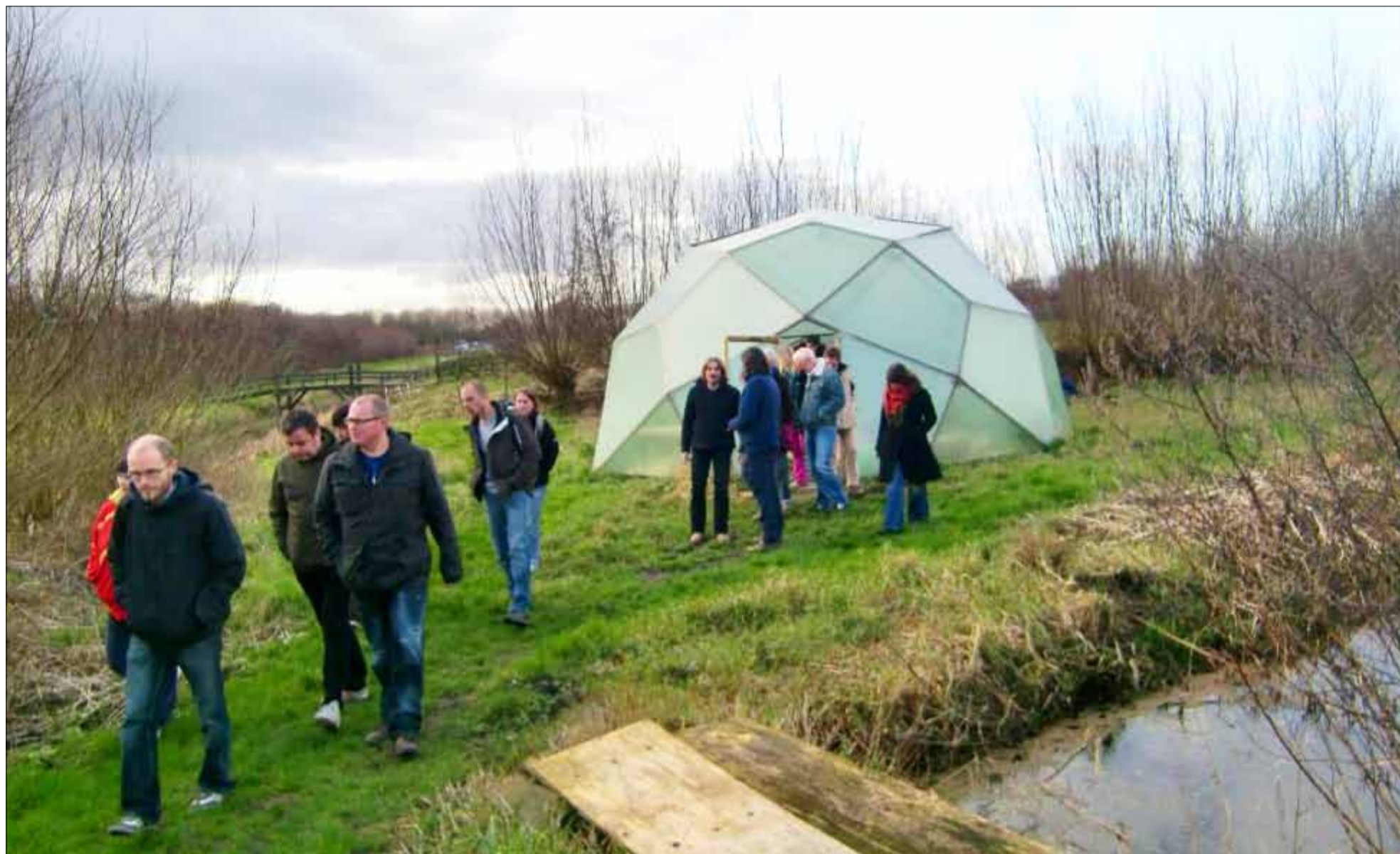
De glazen koepel

Een speciale uitgave van SONOR februari - maart - april 2012