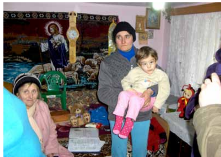
Een spastisch meisje.

gebruiken. Zo zijn er steeds allerlei problemen. Soms draait het om vervoer, zo erg zelfs, dat een terreinwagen nog nog moeite heeft om van a naar b te gaan. Eind mei gaan allerlei zaken weer op transport naar Roemenië. Dus als u aan het opruimen slaat en spullen over hebt, kunt u die brengen naar de Nieuwemeer 101 op maandag en woensdagmorgen van 09:15 uur tot 12:45 uur.