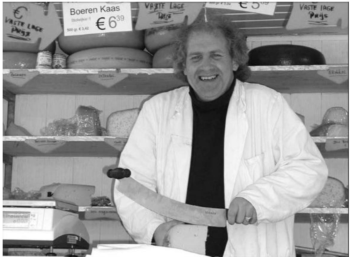
De kaaswagen, uw kaas - specialist.