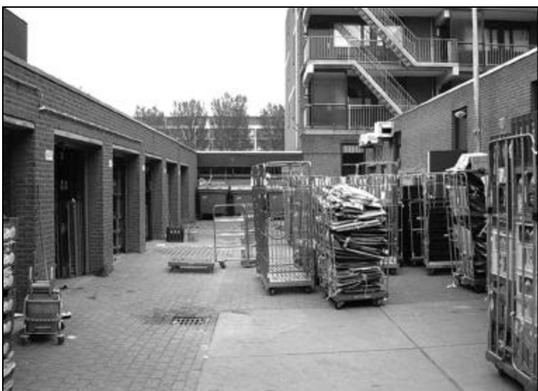
Knelpunt door de bewoners aangedragen.

Vier keer per jaar gaat een flinke groep mensen bestaande uit bewoners, medewerkers van de Roteb, deelgemeente, stadstoezicht, gemeentewerken en het opbouwwerk op de fiets de wijk door om de kwaliteit van van de buitenruimte te beoordelen.