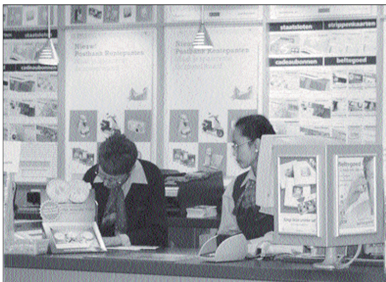
De balie medewerkers druk aan het werk. Volgende klant!