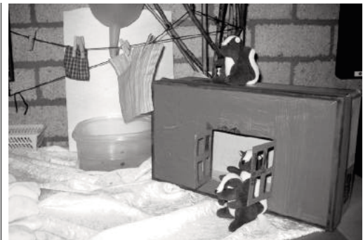
Dit is een vertelafel. Er zitten hele verhalen aan een voorstelling gekoppeld.

Dit jaar zal deze activiteit dus niet doorgaan.