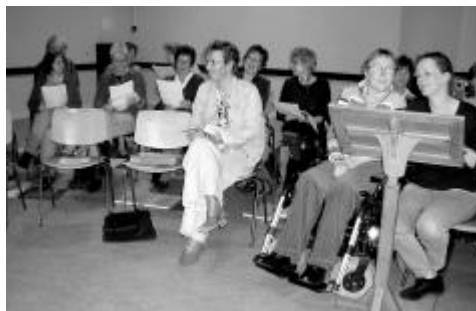
Vrolijke zestiger jaren nummers doen de mens goed.

Het begon twaalfeneenhalf jaar geleden toen een aantal dames behoefte kregen aan een koor waar popmuziek werd gezongen. Aangzien noch in Zevenkamp noch in de omgeving een pop koor bestond, richtten de dames zelf een koor op. Het moest wel beslist pop muziek uit de zestiger en zeventiger jaren zijn. Niet eerder en niet later, omdat juist die pop muziek hen aansprak.