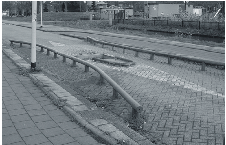
Bussluis Victor van Vrieslandstraat.

af en toe belemmerd worden. Er zal tijdelijk meer gebruik moeten worden gemaakt van de parallelwegen. Om een zo goed mogelijk doorstroming te behouden zal vanaf de start van de werkzaamheden voor de gehele periode van de uitvoerende werkzaamheden de bussluis tussen de Victor van Vrieslandstraat en de Cole Porterstraat worden weggehaald, zodat het verkeer uit de noordoosthoek van Zevenkamp een alternatieve verbinding heeft en de drukte beter verdeeld wordt. Wanneer er op bepaalde plaatsen belemmeringen zijn of parkeren op bepaalde plaatsen niet mogelijk is, zullen bewoners van die delen van de wijk hierover apart worden