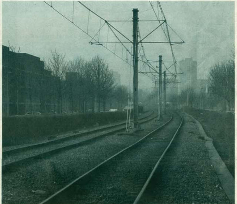
Metrozicht richting Ommoord.

Volgens de RET ook weinig gevoelig voor graffiti! De schermen worden niet van glas omdat