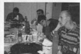
In Uittiebuis aan de maaltijd.

Dat kan bij Uittiebuis. Wij zijn altijd op zoek naar nieuwe vrijwilligers want een groot aantal activiteiten draait dankzij de enorme inzet van vrijwilligers. We zoeken onder andere nog vrijwilligers voor diverse kinderactiviteiten en voor activiteiten met verstandelijk gehandicapten.