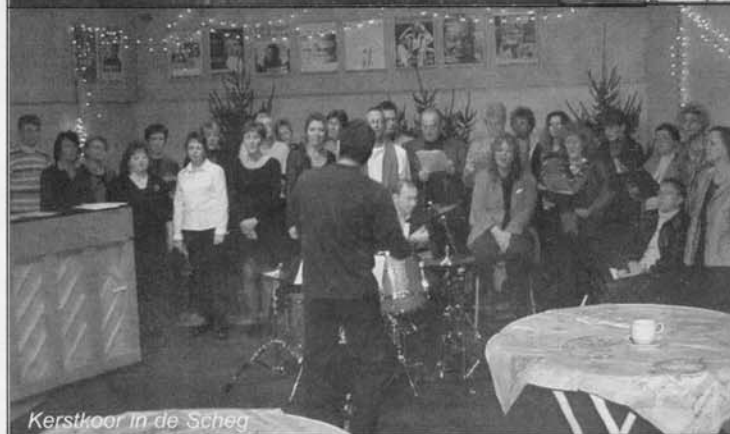
Kerstkoor in de Scheg