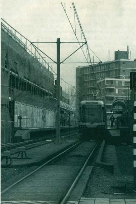
De metrobaan tussen het Leger des Heils en Super de Boer.

meente wil geen vrijstelling verlenen omwille van het welzijn van haar bewoners en vanwege de leefomgeving. Ook wil de deelgemeente dat na het plaatsen van de schermen metingen worden verricht om na te gaan of de verwachtingen vooraf ook uitkomen: Bij negatief resultaat moeten maatregelen worden genomen, bijvoorbeeld de snelheidsverhoging achterwege laten.