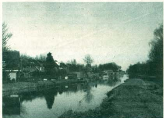
De Ringvaart.

Wie nog dichterbij huis een fietsroute wil volgen, kan de bruine route rondom Zevenkamp en Ommoord nemen. Een prachtig gevarieerd gebied langs de mooiste plekjes van Prins Alexander. Fiets daarvoor langs de zuidkant van de Zevenkampse Ring richting Nesseland en sla bij de Jacques de Graafweg links af. Wie goed kijkt, ontdekt langs deze weg zowel een vlindertuin als een paddenpoel. Fiets door tot aan de Wollefoffenweg waar nog meer padden in een poel