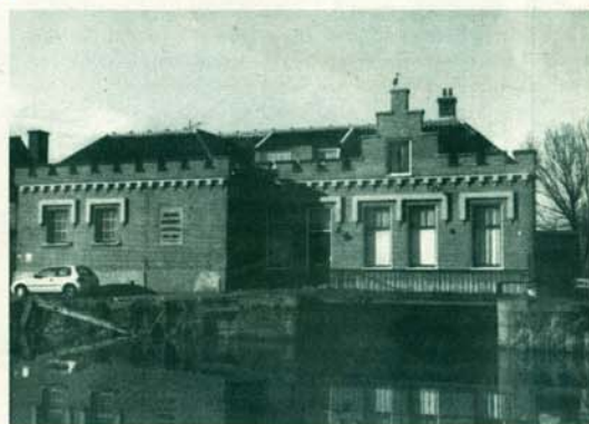
Het oude stoomgemaal met het huidige museum.

en de zoon van koning Willem III, Prins Alexander legde destijds de eerste steen van het gemaal. Daarmee is de naam van onze polder ook gelijk verklaard. In tijden van wateroverlast kan het oude stoomgemaal nog steeds gebruikt worden. Wie een bezoekje aan het museum wil brengen moet op zaterdagmiddag komen tussen 13.00 en 16.00 uur. Een afspraak maken voor een andere dag kan ook: telefoon 4518003. Aan de overkant van het gemaal, aan de andere zijde van de Ringvaart, loopt een leuk wandelpad en wie op de fiets naar het gemaal wil, kan de paarse route van de groenkaart volgen.