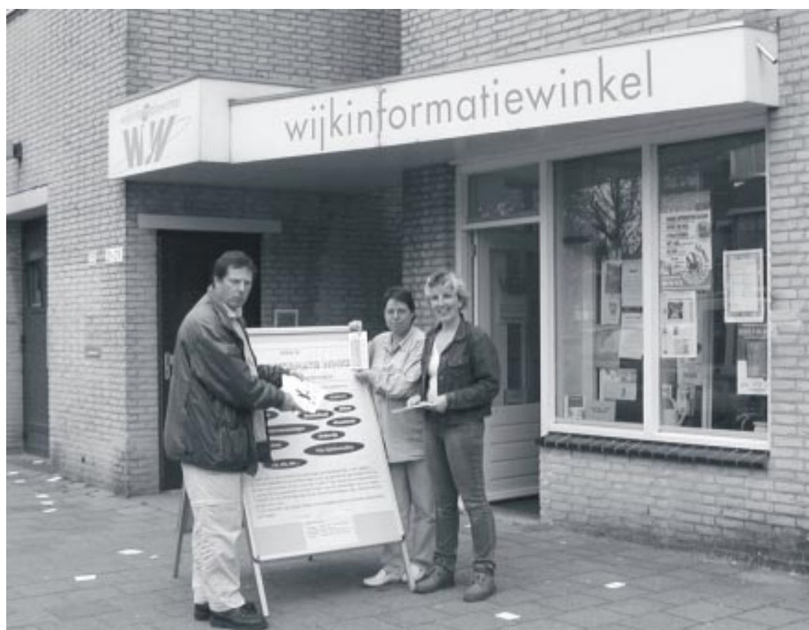
De WijkInformatieWinkel aan de Imkerstraat rechts naast de betaalautomaat.

Vrijwilligers: ze zijn onmisbaar. Geef u op!