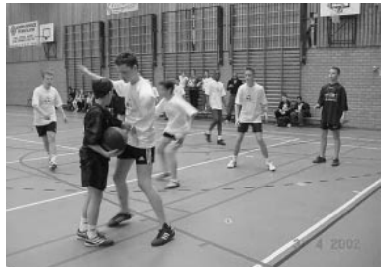
Wedstrijd jongens Buskes-Waterlelie.