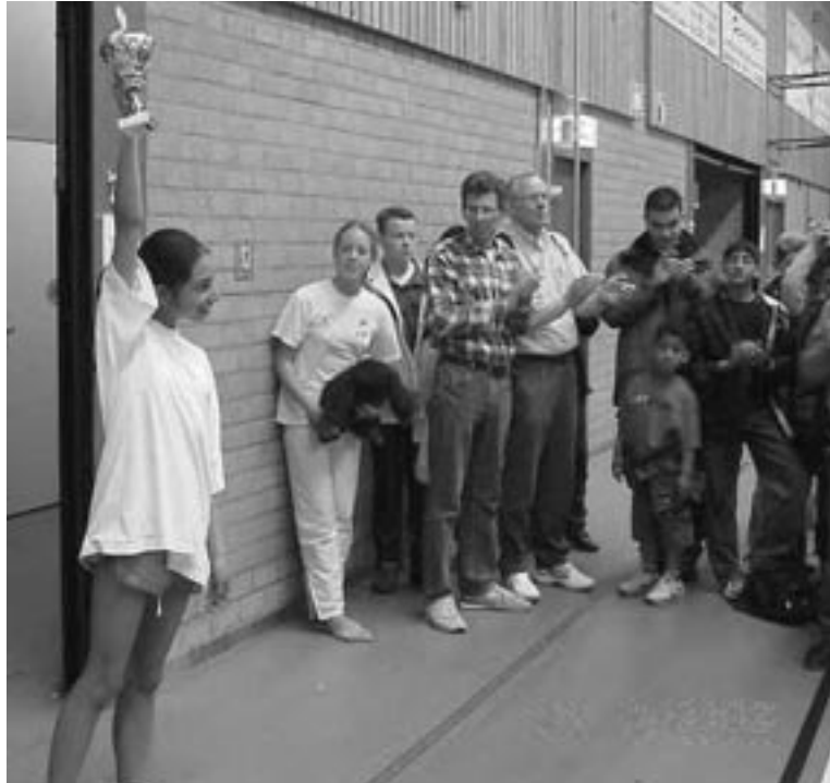
3e prijs de Buskesschool-1