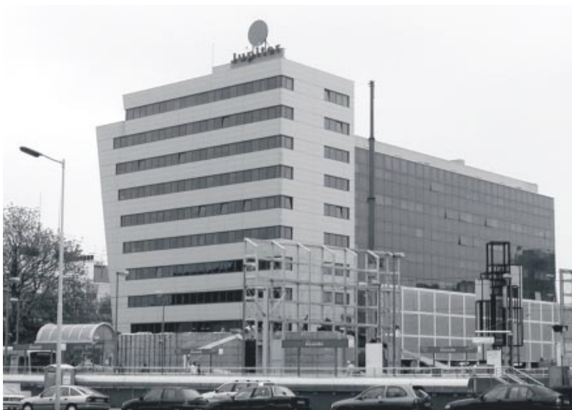
Hier zetelt de Deelgemeente Alexander, vlakbij metrostation Alexander.