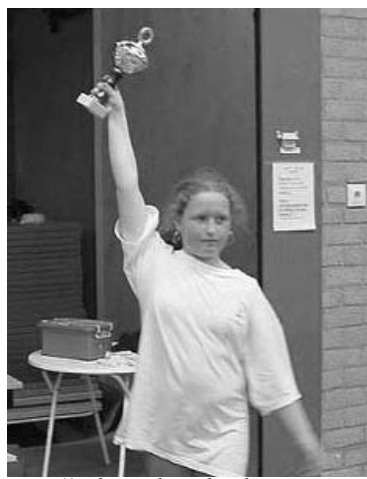
2e prijs de Buskesschool-2