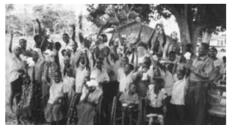
Hier sta ik temidden van de kinderen na hun blijdschap om de geiten.