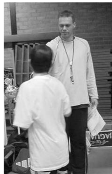
1e prijs de Buskesschool-3