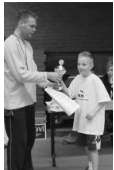
2e prijs de Buskesschool-6