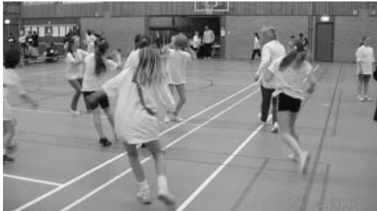
Wedstrijd meisjes Waterlelie-Buskes.