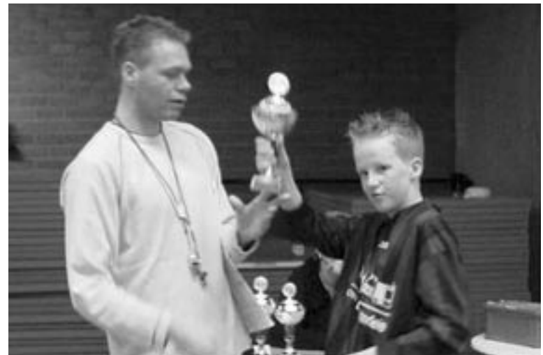
3e prijs de Waterlelie-1