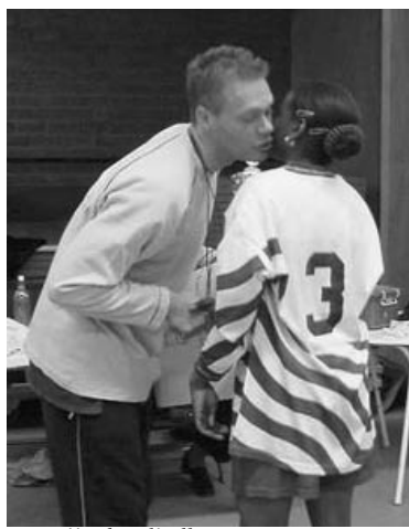
1e prijs de Vliedberg-1

Wilt u ook iets meedelen, latenplaatsen van foto's of wat dan ook vanuit uw school in Zevenkamp? Breng het langs of bel even met de Bugel. Telefoon 010-2892400