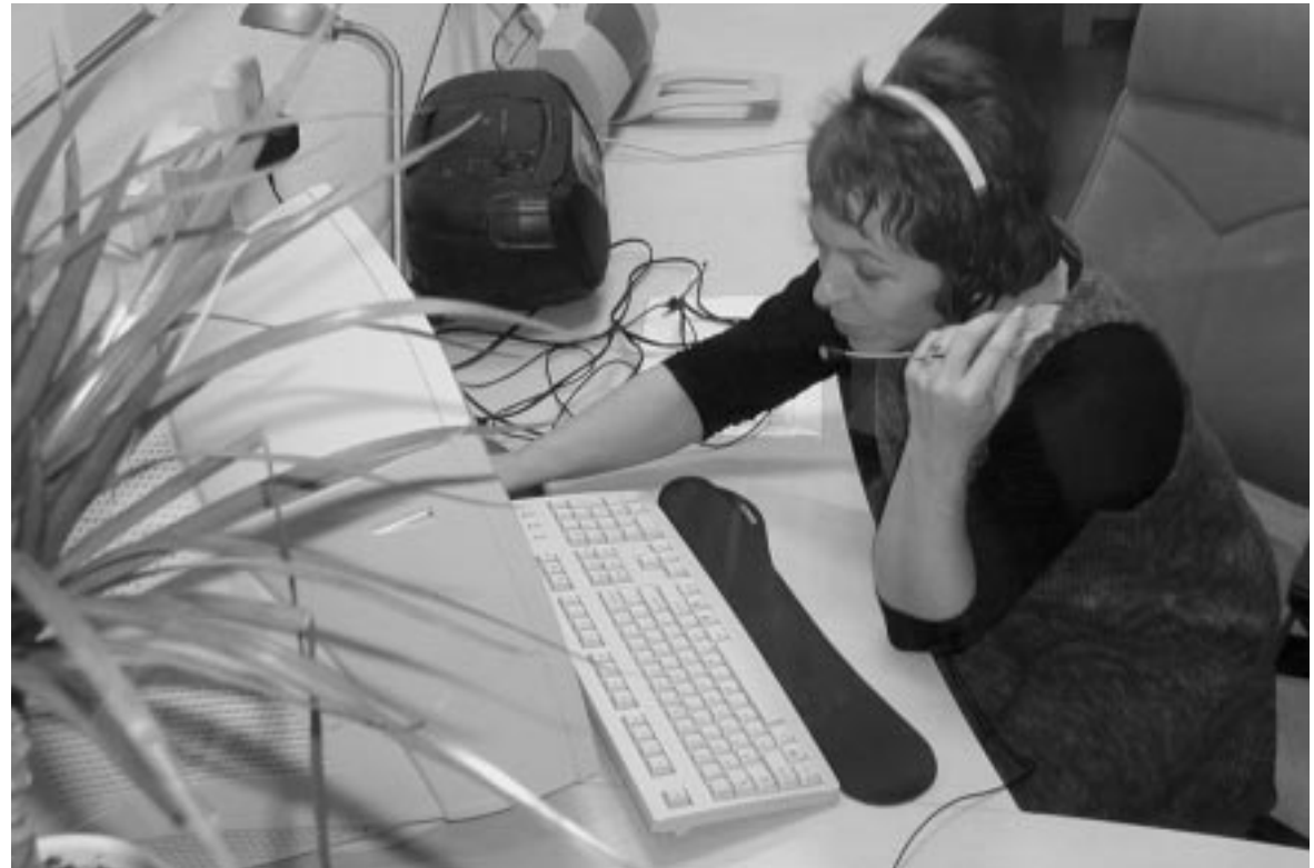
De huisartsassistente is het eerste aanspreekpunt op de huisartsenpost.

Je ligt lekker te slapen. Dan wordt er om drie uur 's nachts aan je deur gebeld. Slaperig sta je op, vraagt nog wie is daar? Je hoort zachtjes, heelp. Je doet de deur open, ziet even niets, kijkt naar beneden en nog dringt het niet tot je door. Daar ligt je buurvrouw, omgeven door bloed, om hulp roepend. Wat nu vraag je je af. De dokter bellen is je eerste impuls. Snel het nummer gedraaid, niet thuis natuurlijk. Gelukkig geeft het antwoordapparaat een nummer dat je kunt bellen als je hulp nodig hebt. Het nummer van de huisartsenpost.