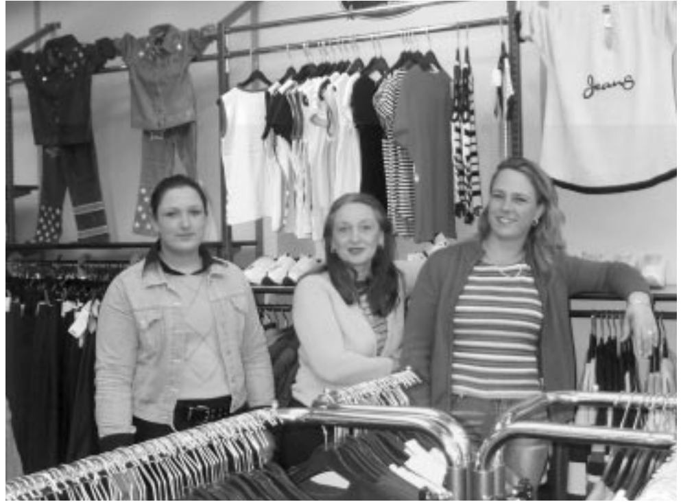
Het personeel van Landgraaf Zevenkamp

Het winkelpersoneel in Zevenkamp ziet Landgraafmode bovenal als een gezellig bedrijf waar het fijn werken is. De filialen zijn wijdverspreid langs de kust te vinden in voornamelijk kleine plaatsen want Landgraaf heeft een voorkeur in kleinere gemeenten als vestigingsplaats, zoals Berkel en Numansdorp. Omdat de filialen zo goed lopen wordt circa drie keer in de week de collectie aangevuld.